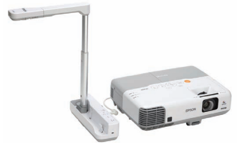
Del 3D-genstande ved hjælp af ELP-DC06-dokumentkameraet